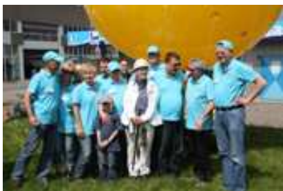
Die Betreuungsmannschaft am Schacht 1*

In der Zeit vom 22. – 30. Mai fand im Ruhrgebiet die Aktion Schachtzeichen statt. Insgesamt 311 gelbe Ballone ragten bis zu 80 Meter in den Himmel, an Stätten, wo einmal eine Zeche bzw. ein Schacht vorhanden waren.