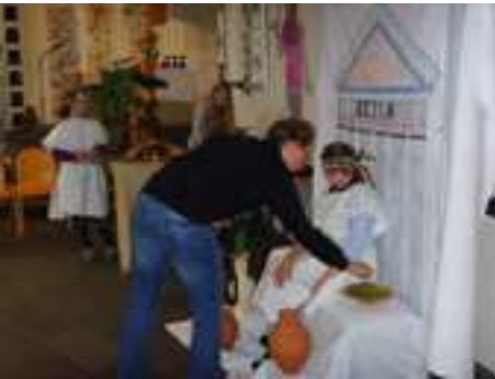
← Im Fotostudio konnten sich die Kinder vor stilgerechter Kulisse Fotografieren lassen.

30 Römerinnen und Römer am Ende des Vormittags