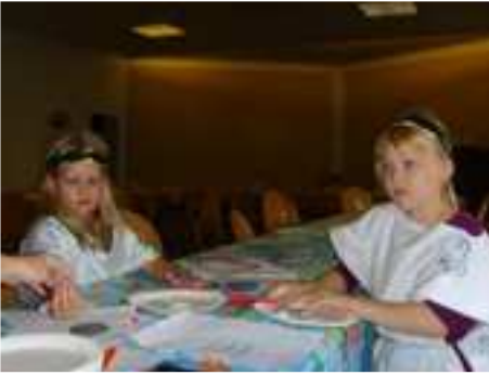
Auch mit Ton konnte das Zeichen des Fisches modelliert werden.