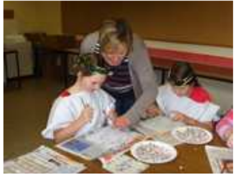
Und ein Fischmosaik wurde auf eine Kachel geklebt.